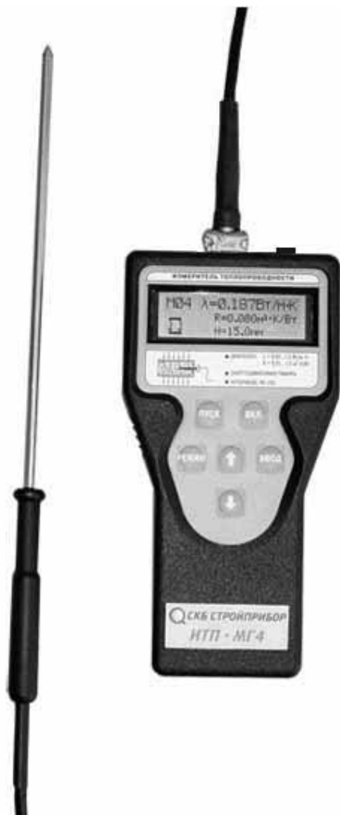
Рисунок 1.1 - Общий вид прибора ИТП-МГ4 «Зонд»